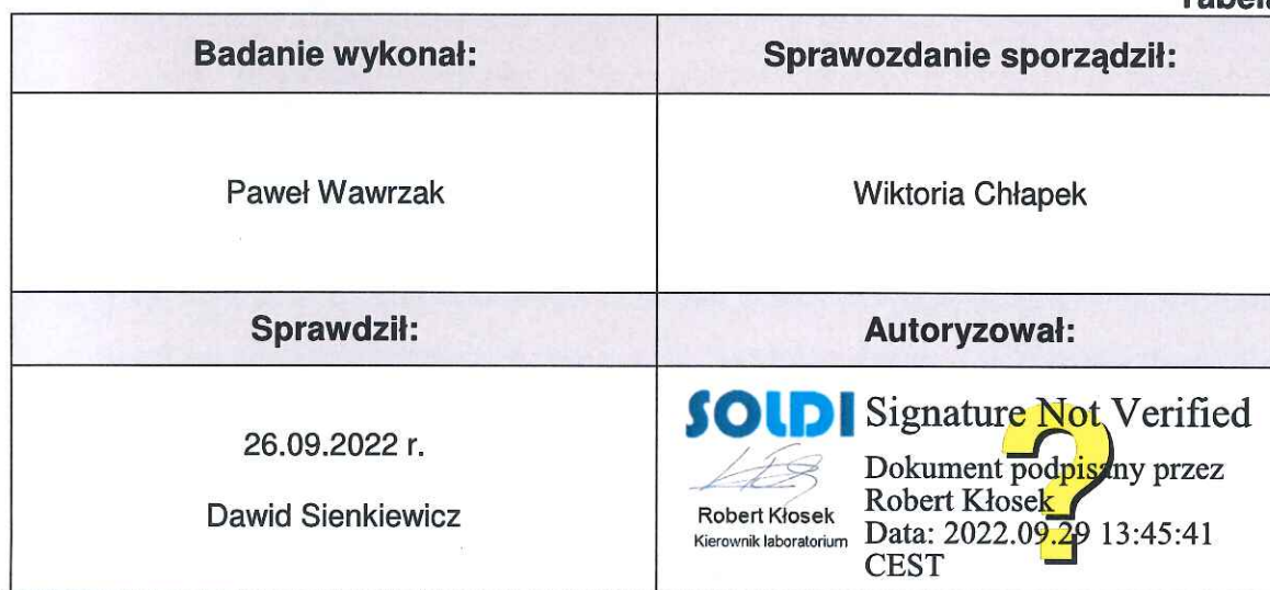
Tabela nr 6

Stwierdzenia zgodności dokonano na podstawie zasady podejmowania decyzji i wymagań zawartych w załączniku do Rozporządzenia Ministra Klimatu z dnia 17 lutego 2020 r. w sprawie sposobów sprawdzania dotrzymania dopuszczalnych poziomów pól elektromagnetycznych w środowisku [Dz. U. 2020, poz. 258, Dz. U. 2022, poz. 1121].