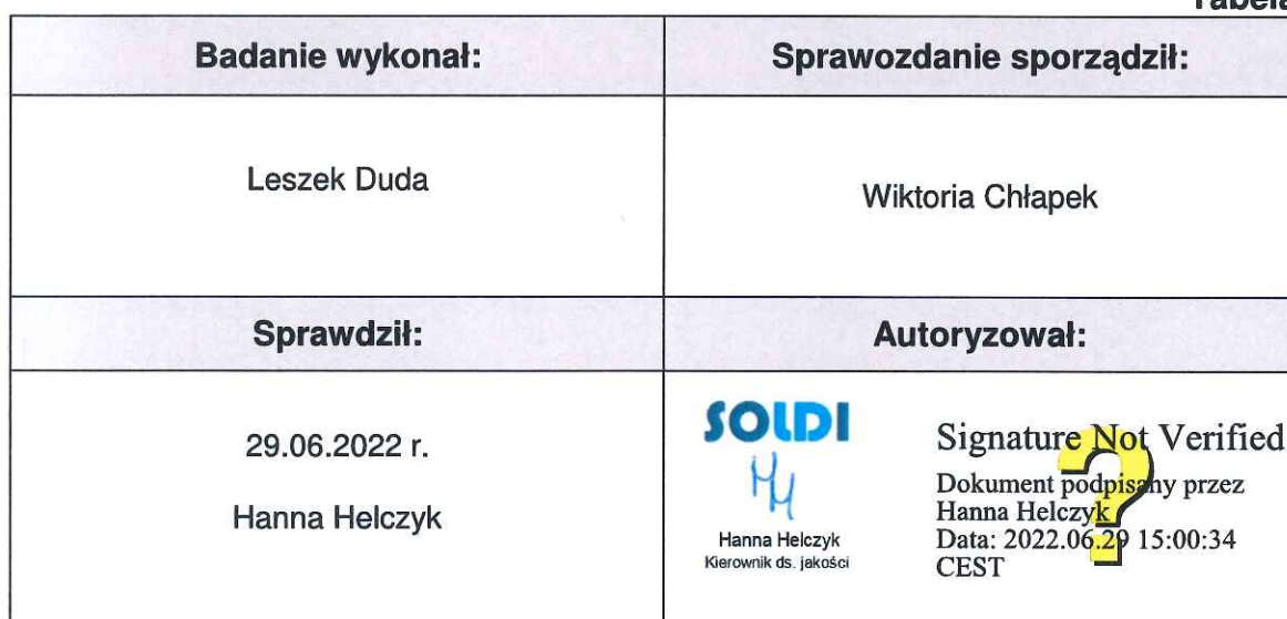
Tabela nr 6

Signature Not Verified Dokument podpisany przez Hanna Helczyk Data: 2022.06.29 15:00:34 CEST